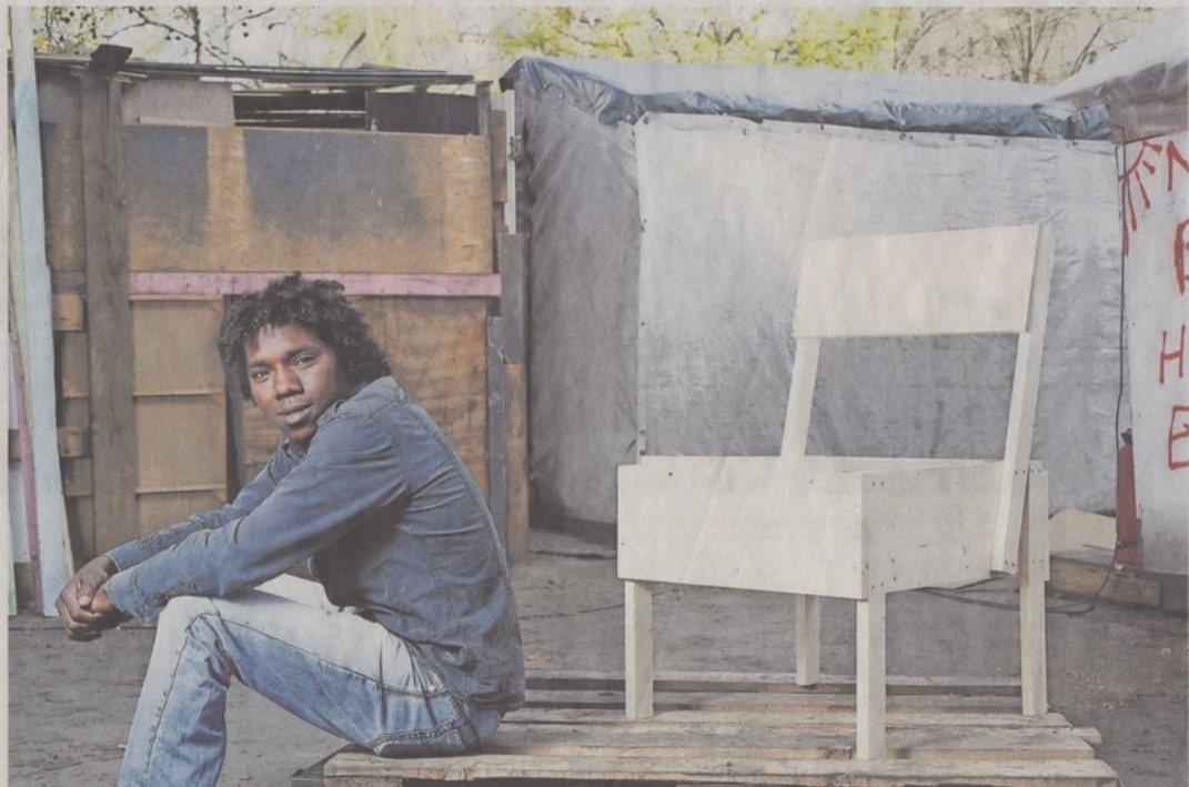
Von der Werkstatt in Kreuzberg zur Mailänder Möbelmesse: Der Stuhl „Sedia Uno“ und einer seiner Erbauer – ein junger Mann, der aus Afrika geflüchtet ist und über Lampedusa nach Europa kam.