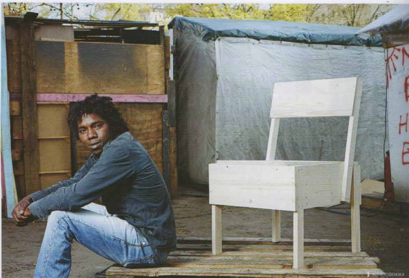
1.2 依自己偏好再替家具作微調，讓CUCULA的產品多了份人的溫度。